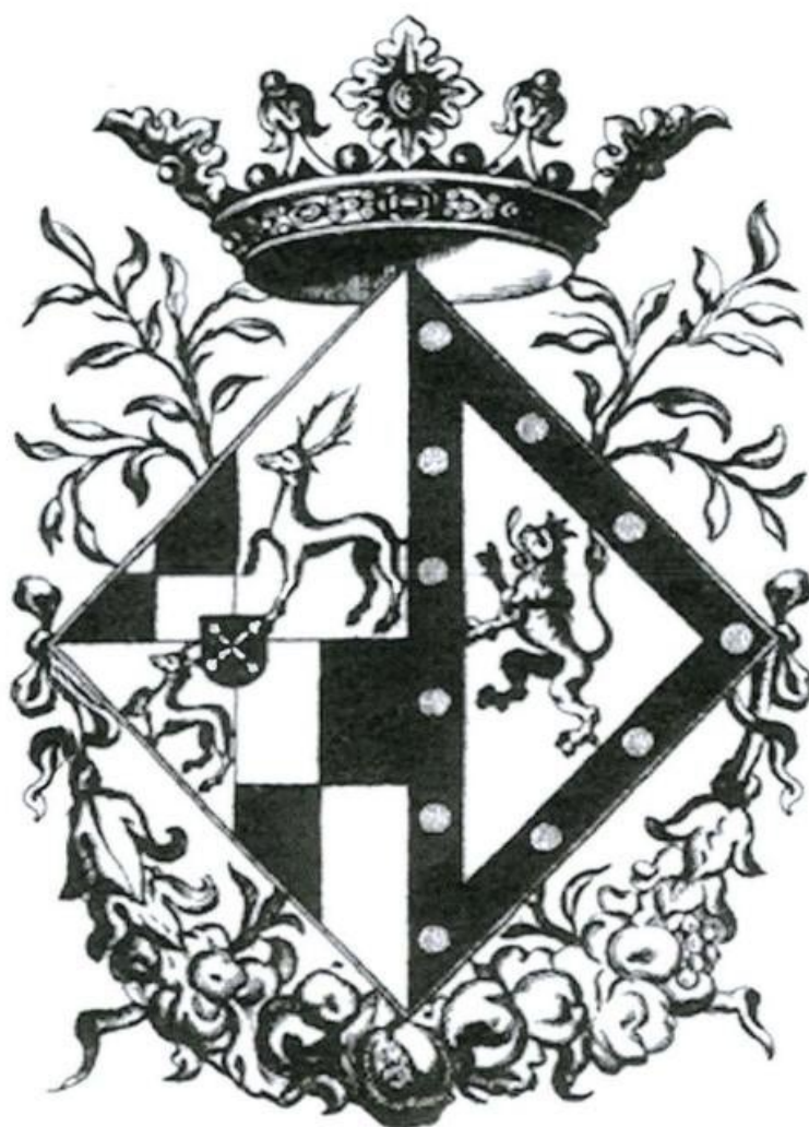
Wapen van Maria-Elisabeth II van den Bergh